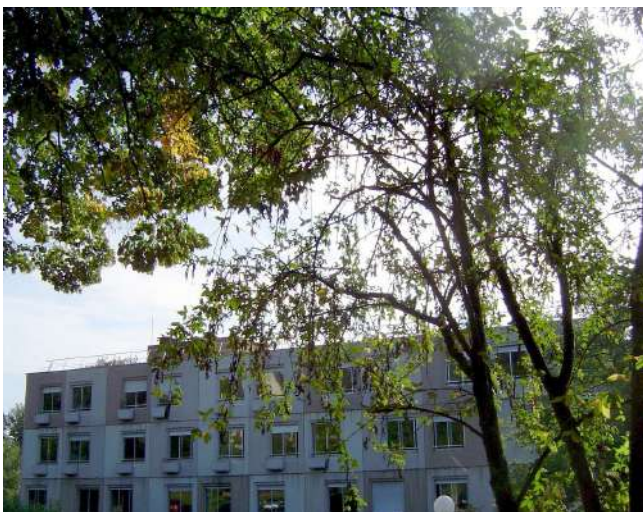
Bâtiment des services Médecine et Soins Médicaux et de réadaptation