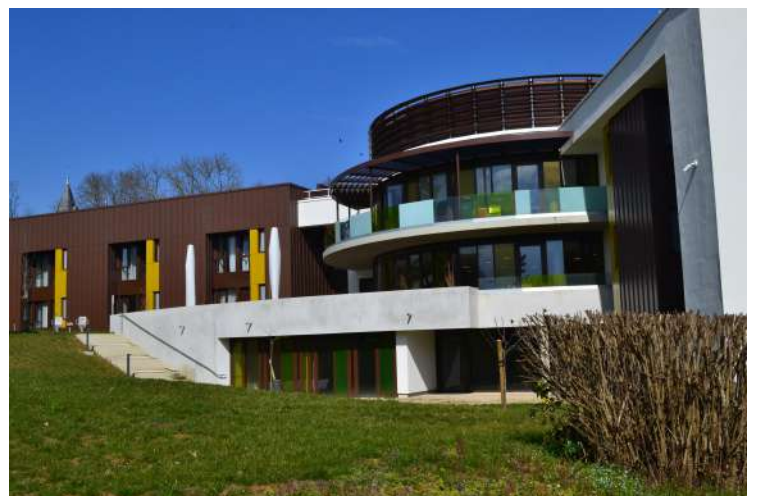
Bâtiment des services La Doue, La Dolive, La Seille et du PASA